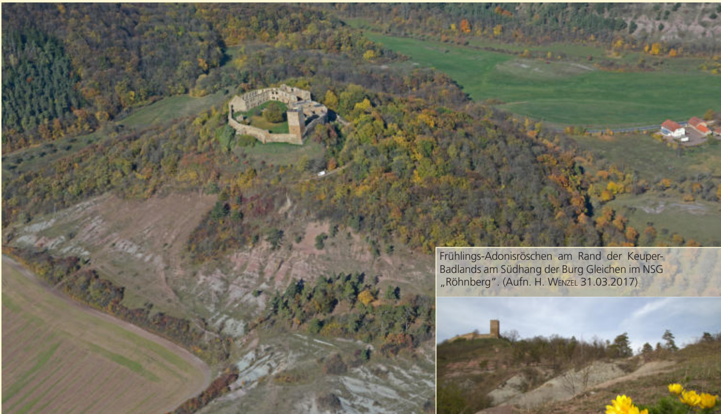
Frühlings-Adonisröschen am Rand der Keuper-Badlands am Südhang der Burg Gleichen im NSG „Röhnberg“.