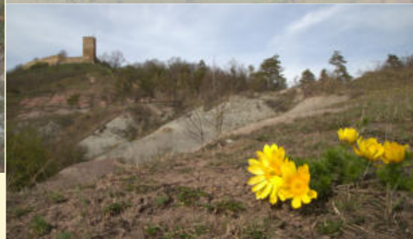
Naturdenkmal „Springquelle“ in Mühlberg.