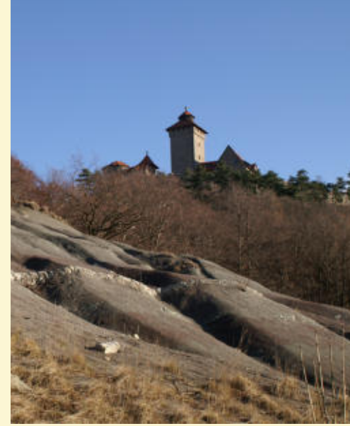
Keuper-Badlands im NSG „Wachsenburg“.